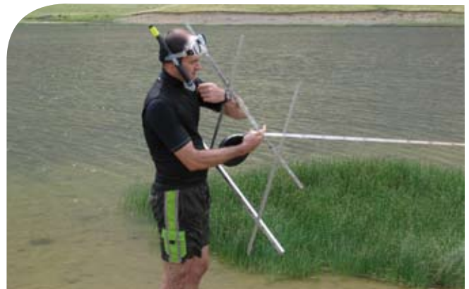
Preparando el muestreo subacuático en el Ibón de Piedrafita

A la vista del hallazgo, dos de nosotros (JLB y AA) decidimos hacer una prospección preliminar del lago para confirmarlo, el 26 de septiembre de 2009, antes de que las aguas se enfriaran más. Para ello utilizamos equipo de buceo ligero y la técnica del snorkel