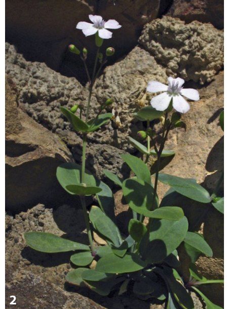
1. Stachys maritima . FOTO: CESAR BLANCHÉ. 2. Petrocoptis hispanica . FOTO: AUTOR. 3. Cynara tournefortii . FOTO: JUAN MANUEL MARTÍNEZ LABARGA.