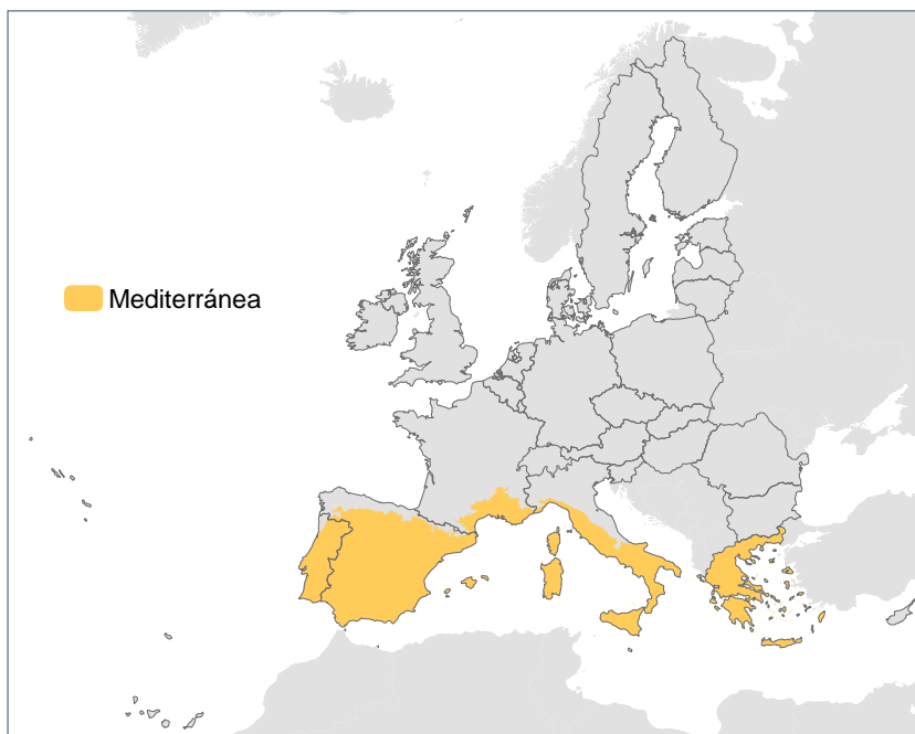
Figura 1.1 Mapa de distribución del tipo de hábitat 3290 por regiones biogeográficas en la Unión Europea. Datos de las listas de referencia de la Agencia Europea de Medio Ambiente.